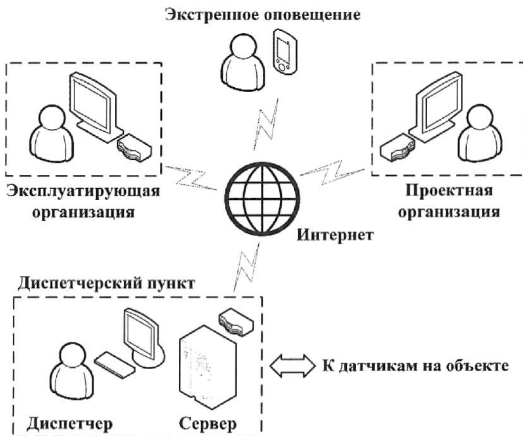
Рисунок 1 - Схема передачи информации