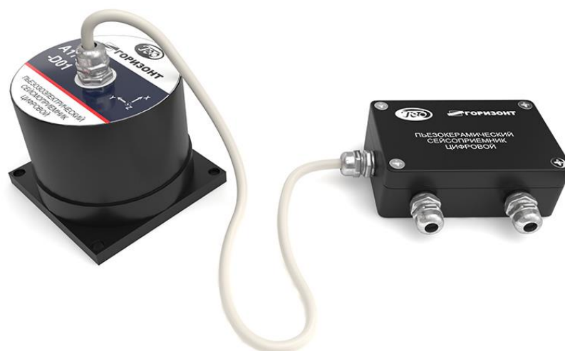
Рис.1 - Внешний вид цифрового пьезоэлектрического сейсмоприемника A1638-D01

1.5.1 Внешний вид цифрового пьезоэлектрического сейсмоприемника A1638-D01 представлен на рис.1