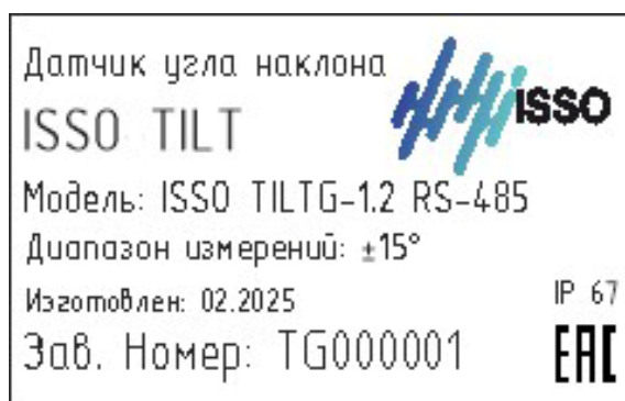
Рисунок 3 – Общий вид маркировочной наклейки

Пломбирование датчиков не предусмотрено. Нанесение знака поверки на датчики не предусмотрено.