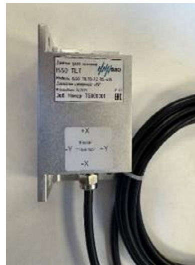
Рисунок 2 – Внешний вид датчиков угла наклона ISSO TILTG-1.2 RS-485