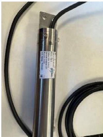
Рисунок 1 – Внешний вид датчиков угла наклона ISSO TILT1